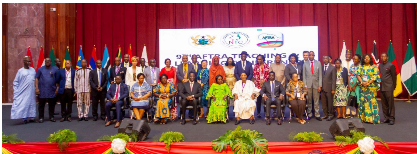
Séance photo des ministres de l'éducation et des dignitaires @ Ghana 2022