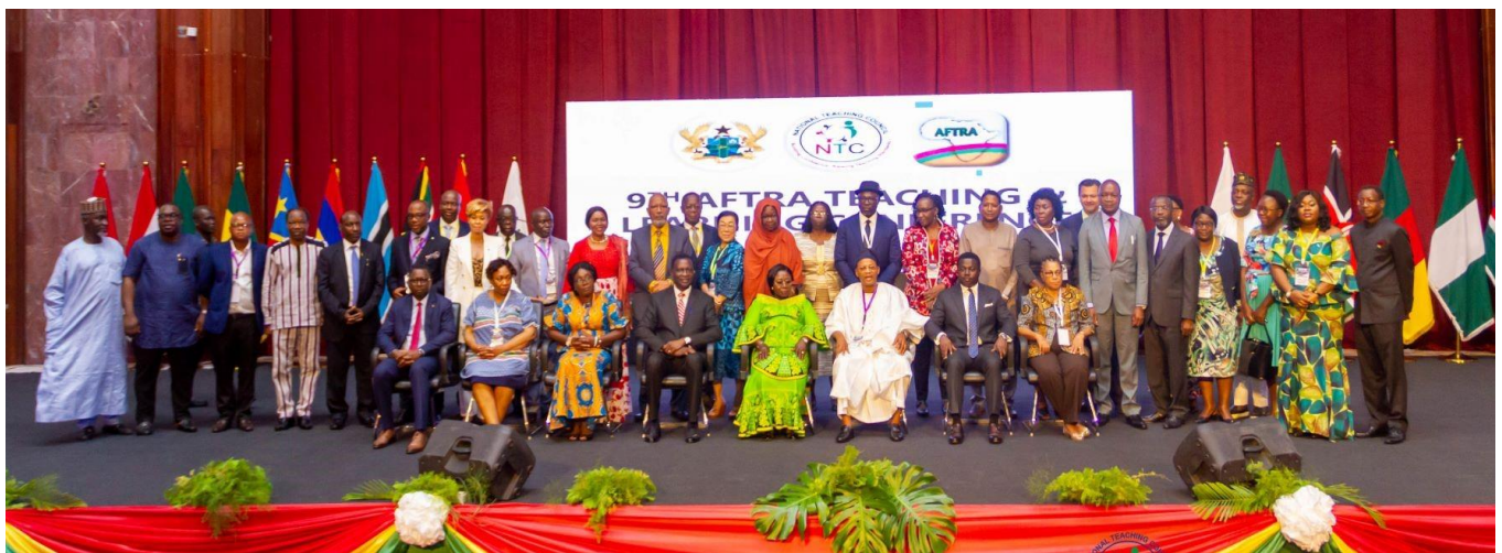
Sessão de fotos dos Ministros da Educação e Dignitários @ Gana 2022