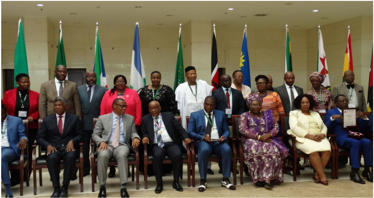
Photo: Dr Motsoahae Thomas Thabane, le Premier Ministre du Lesotho ; Ministres de l'Éducation; Commissaire RHST de l'UA ; et d'autres dignitaires lors du 10 e anniversaire de l'AFTRA à Maseru, Lesotho, 2019