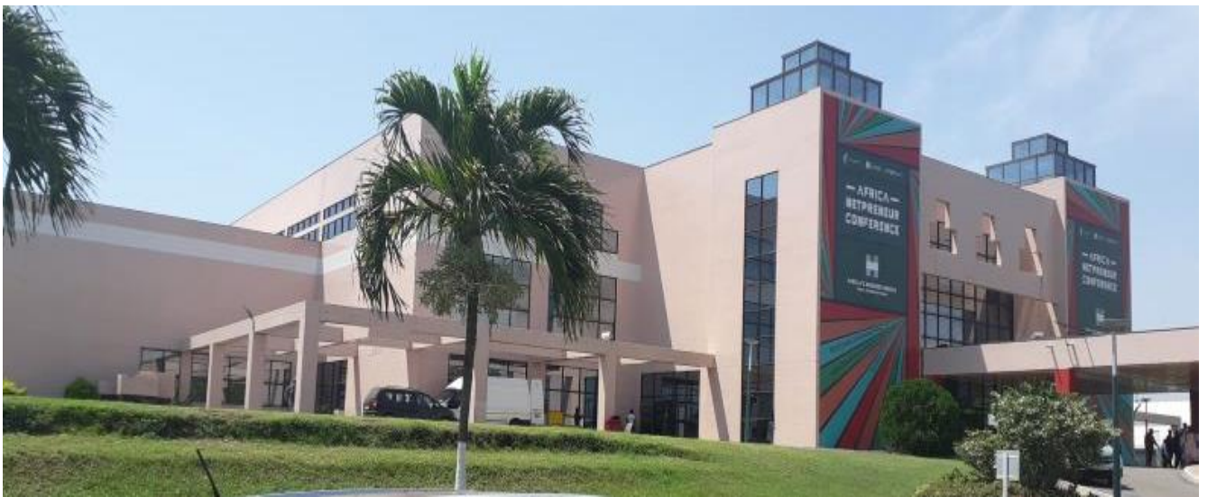
Le Centre International de Conférences, Accra Ghana